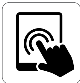
možnost ovládní dotykových displejů ovládanie pomocou dotykovej obrazovky possibility to touch screen możliwość pracy z ekranami dotykowymi